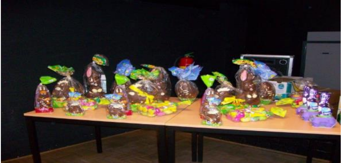
Dit zijn de prijzen